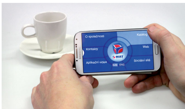
Hlavní menu aplikace na mobilním telefonu