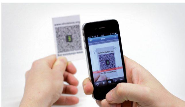
Skenování QR kódu do mobilního telefonu